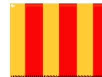
Pludseligt opstået glat føre