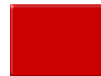
Fuld stop for alle kørere