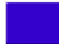
Giv plads til overhaling